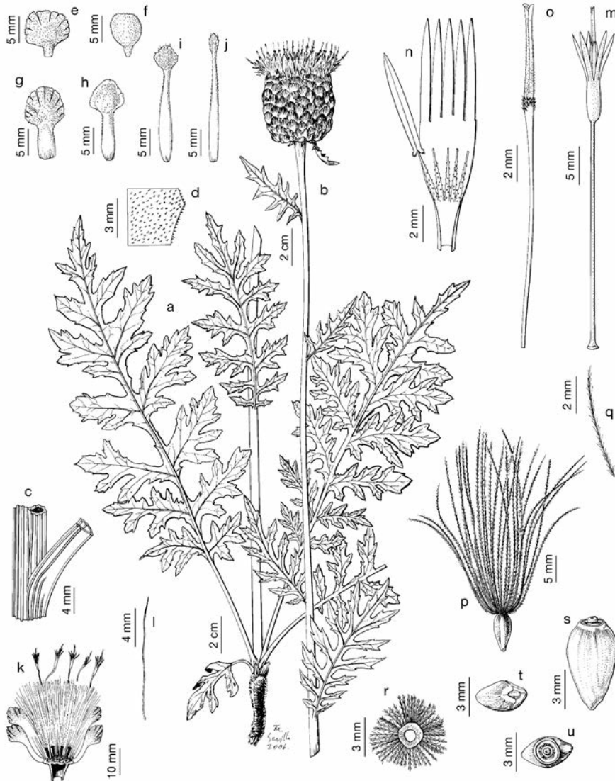
Lám. 000.— Rhaptoticum exaltatum , a-l) Pinar de Hoyocasero, Ávila (MA 366814); m-o) ibídem (UNEX 34401); p-u) entre Los Navalucillos y Navaltoril, Toledo (MA 351389); a) base del tallo con hojas y sistema radical; b) porción apical de un tallo florido; c) detalle de un nudo del tallo y de la inserción de una hoja; d) fragmento de una hoja que muestra el indumento de la cara adaxial; e, f) brácteas externas del involucre; g, h) brácteas medias del involucre; i, j) brácteas internas del involucre; k) sección longitudinal de un capítulo; l) pálea del receptáculo; m) corola y verticilos sexuales; n) limbo de la corola abierto que muestra los filamentos estaminales y un estambre completo; o) estilo y ramas estilares; p) aquenio con vilano; q) pelo del vilano; r) vilano visto desde abajo que muestra el anillo formado por la soldadura de los pelos; s) aquenio en vista lateral; t) aquenio visto desde abajo, que muestra el hilo cárpico; u) aquenio visto desde arriba, que muestra la placa apical.