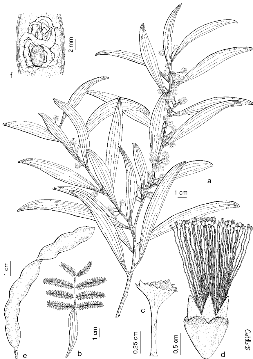
Lám. 1.— Acacia melanoxylon , a, c, d) Santiago de Compostela, La Coruña (MA 546681); b) pr. Villagarcía de Arosa, Pontevedra (MA 433230); e, f) Lens, Ames, La Coruña (MA 546682): a) rama florífera; b) hoja primordial; c) bráctea floral; d) flor; e) fruto; f) sección del fruto, con semilla y funículo.