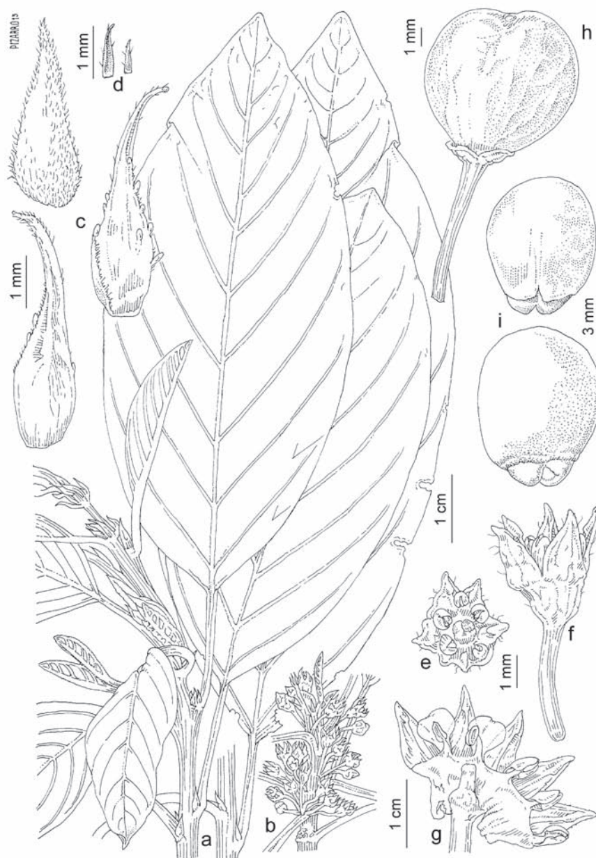
Lám. 12.— Frangula alnus subsp. baetica . a) barranco de Ojén, Sierra de la Palma, Cádiz, loc. class. (MAF 94957); b, d-g) Sierra del Niño, Los Barrios, Cádiz (MA 302394); c) ibídem (MA 355569); h) ibídem (MA 293434); i) barranco de Ojén, Sierra de la Palma, Cádiz, loc. class. (MAF 91214): a) ápice de una rama; b) inflorescencias; c) estípulas; d) hipsofilos; e, f) flor, vistas cenital y lateral; g) flor abierta; h) fruto, vista lateral; i) semillas, vistas ventral y dorsal.