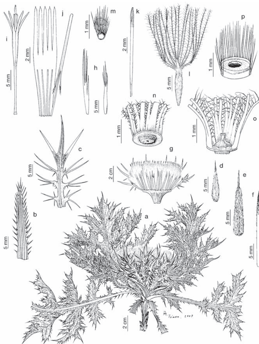
Lám. 5.— Carlina gummifera , a-c) Los Santos de Maimona, Badajoz (UNEX 7827); d-f, k-p) Badajoz (UNEX 35481); g-j) entre Almonáster y La Corte, Huelva (SEV 49006); a) hábito; b) hoja caulinar; c) hoja involucral; d) bráctea externa del involucre; e) bráctea media del involucre; f) bráctea interna del involucre; g) sección longitudinal de un capítulo que muestra las páleas del receptáculo; h) páleas del receptáculo; i) corola de una flor en antesis y tubo estaminal atravesado por el estilo; j) sección longitudinal del limbo de una corola que muestra los filamentos estaminales y un estambre completo; k) parte superior del estilo con sus ramas; l) aquenio con vilano; m) base del aquenio y hilo cárpico; n) detalle de la base del vilano; o) detalle de la placa apical del aquenio, con el nectario y la parte basal del vilano; p) parte superior del aquenio tras desprenderse la placa apical.