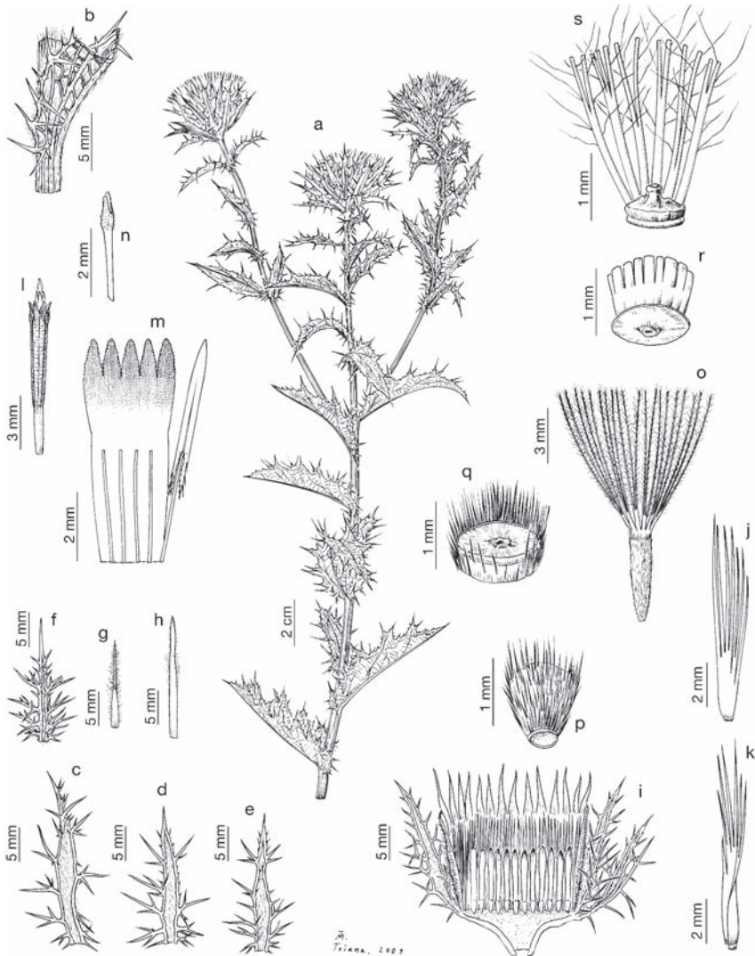
Lám. 1.— Carlina vulgaris subsp. spinosa , a, b, i-k) carretera a Gistaín desde San Juan de Plan, Huesca (UNEX 35644); c-e) puerto de la Bonaigua, Lérida (UNEX 35645); f-h) Lizarra, Navarra (MAF 73695); l-r) Torre la Ribera, Vilas del Turbón, Huesca (UNEX 35646); s) Sepúlveda, Segovia (MAF 87082): a) fragmento de un tallo con hojas y capítulos; b) detalle de un nudo y de la inserción de una hoja; c-e) hojas involucrales; f) bráctea externa del involucre; g) bráctea media del involucre; h) bráctea interna del involucre; i) sección longitudinal de un capítulo que muestra las páleas del receptáculo; j, k) páleas del receptáculo; l) corola de una flor en antesis y tubo estaminal atravesado por el estilo; m) limbo de una corola abierto que muestra los filamentos estaminales y un estambre completo; n) parte superior del estilo con sus ramas; o) aquenio con vilano; p) base del aquenio e hilo cárpico; q) parte superior del aquenio tras desprenderse la placa apical; r) detalle de la base del vilano; s) detalle de la placa apical del aquenio con el nectario y la parte basal del vilano.