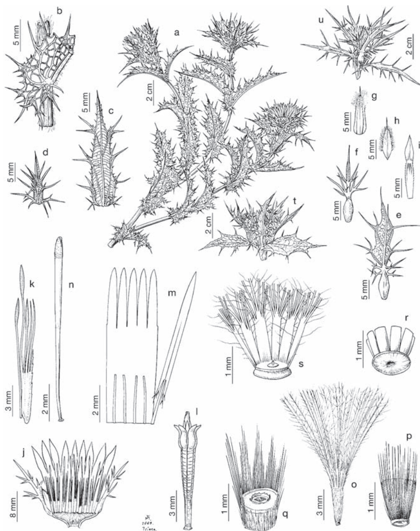
Lám. 2.— Carlina corymbosa subsp. hispanica , a, b, e-i) Islas Cíes, Pontevedra (UNEX 35428); c, d, j-s) Yesa, monasterio de Leyre, Navarra (UNEX 35427); a) fragmento de un tallo con hojas y capítulos; b) detalle de un nudo y de la inserción de una hoja; c, d) hojas involucrales; e, f) brácteas externas del involucre; g, h) brácteas medias del involucre; i) bráctea interna del involucre; j) sección longitudinal de un capítulo que muestra las páleas del receptáculo; k) pálea del receptáculo; l) corola de una flor en anthesis y verticilos sexuales; m) limbo de una corola abierto que muestra los filamentos estaminales y un estambre completo; n) estilo con sus ramas; o) aquenio con vilano; p) base del aquenio e hilo cárpico; q) parte superior del aquenio tras desprenderse la placa apical; r) detalle de la base del vilano; s) detalle de la placa apical del aquenio, con el nectario y la parte basal del vilano. C. corymbosa subsp. major ; t) cabo de Estaca de Bares, La Coruña (UNEX 35426); capítulo. C. corymbosa subsp. corymbosa (var. graeciformis ), u) Las Salinas, Ibiza (BC 90840); capítulo.